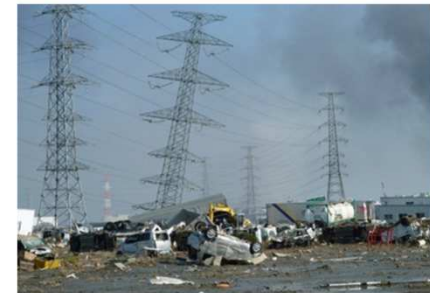
【傾斜した鉄塔(宮城県多賀城市)】